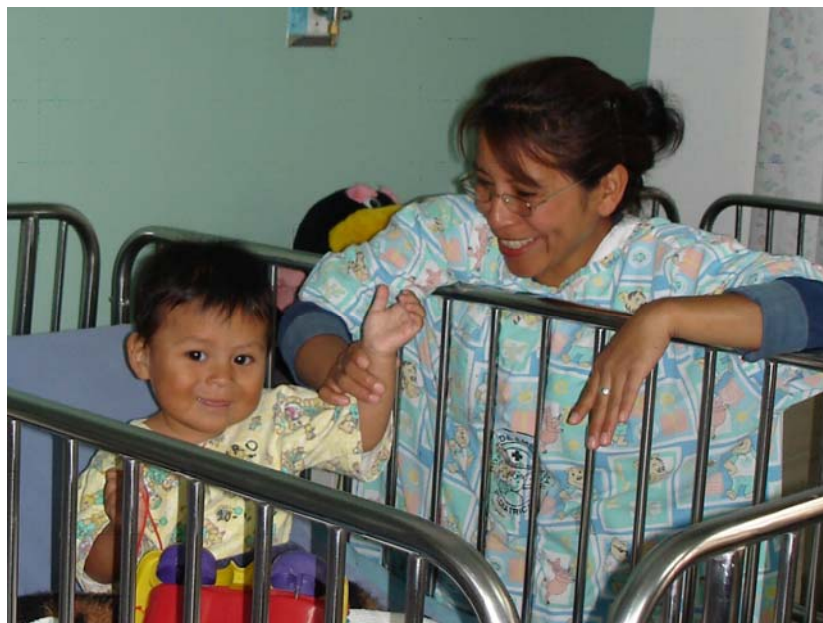
Sala de Hospitalización de Medicina Pediátrica. 3er. Piso