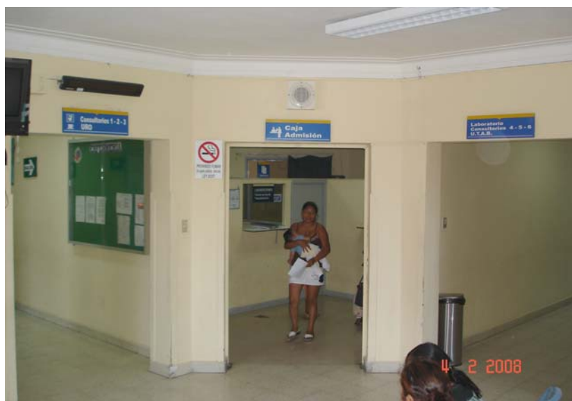
Área de Caja - Admisión Sala de Espera 2do. piso