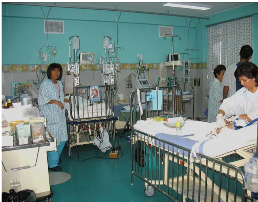
Sala de Hospitalización del Servicio de Terapia Intensiva Pediátrica. 2do. piso.