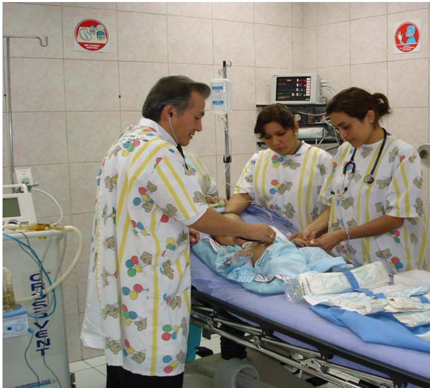
Atención en la Unidad de Shock-Trauma Pediátrico