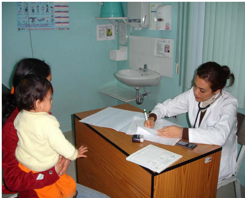
Consultorio de Urgencias