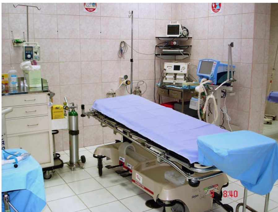
Unidad de Shock -Trauma Pediátrico