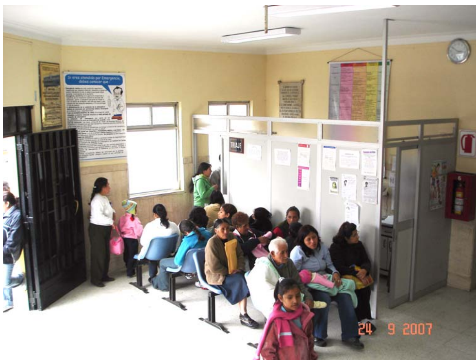
Área de Triage